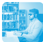
Situation de handicap