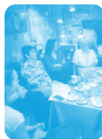
Ateliers de traduction