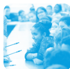
Éducation artistique et culturelle