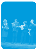
Lectures à voix haute