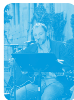
Spectacles & expositions